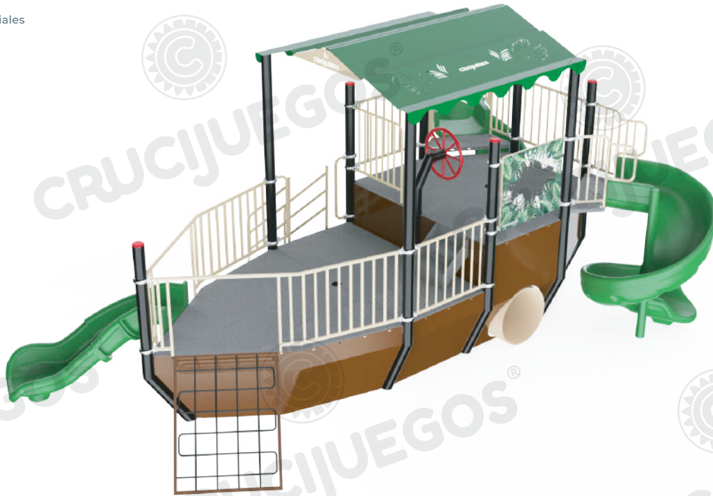
Imagen referencial. Para más información ingrese a www.insumos.crucijuegos.com